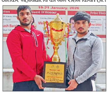
रोहतक। शहीद राय सिंह राजकीय महाविद्यालय सांपला के छत्र ट्रॉफी के साथ।