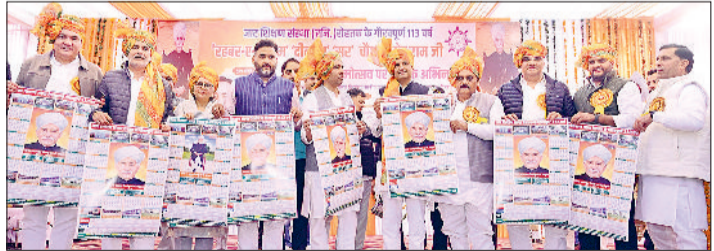
रोहतक। वार्षिक कैलेंडर का विमोचन करते राज्य कौशल विकास एवं उद्यमिता मंत्री जयंत चौधरी, सांसद दीपेंद्र हुड्डा व अन्य संस्था के पदाधिकारी।