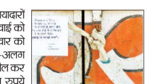
34.10 लाख बकाया, आयुक्त बोले, वसूली और सीलिंग की कार्रवाई और तेज होगी

आयुक्त डॉ. आनंद कुमार शर्मा ने बताया कि संपत्तिक नगर निगम की आय का मुख्य स्रोत है। उन्होंने कहा कि यदि संपत्तिक की समय पर वसूली नहीं होगी तो विकास कार्य प्रभावित होंगे हैं। नगर निगम द्वारा पहले ही संपत्तिक बकायादारों को नोटिस जारी किए जा चुके हैं और बार-बार अपील की गई कि वे समय रहते अपना बकाया जमा करवा लें। बावजूद इसके कुछ लोगों द्वारा लगातार अनदेखी की जा रही थी, जिसके चलते निगम को सख्त कदम उठाने पड़े। नगर निगम की टीमों ने बुधवार को नेहरू कॉलोनी की दो दुकानों, अशोक नगर की एक दुकान और पालिका कॉलोनी की एक दुकान को सील किया। ये सभी वाणिज्यिक संपत्तियां थीं, जिन पर लंबे समय से संपत्तिक बकाया चला आ रहा था।